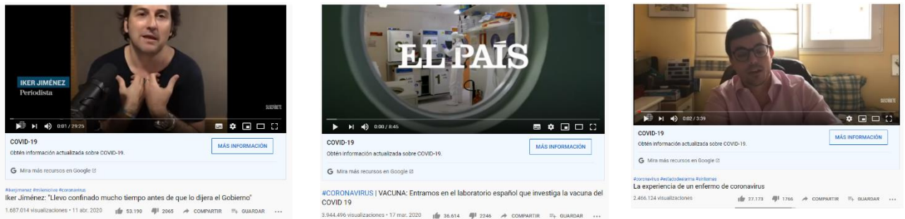
Figura 8. Publicaciones con mayor interacción en YouTube

Por último y en el caso de YouTube, El Mundo vuelve a liderar con su entrevista a Iker Jiménez atrayendo más de 60,8K de interacciones y con otra entrevista que se sitúa en tercera posición (32,1K.). Asimismo, el video sobre el avance de la vacuna española de El País congrega a más de 41,6K., situándose en segunda posición.