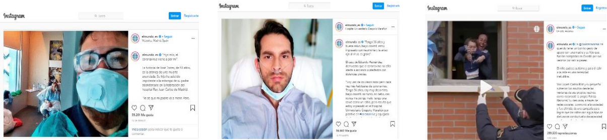
Figura 7. Publicaciones con mayor interacción en Instagram

Por último y en el caso de YouTube, El Mundo vuelve a liderar con su entrevista a Iker Jiménez atrayendo más de 60,8K de interacciones y con otra entrevista que se sitúa en tercera posición (32,1K.). Asimismo, el video sobre el avance de la vacuna española de El País congrega a más de 41,6K., situándose en segunda posición.