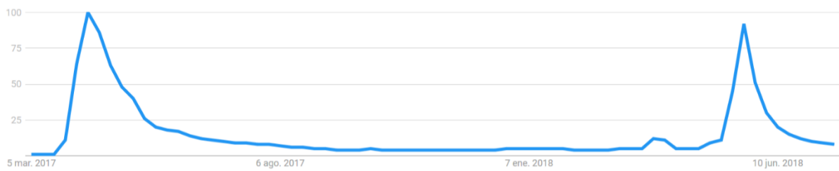
Gráfico 1. Registros de búsquedas en Google Trends. Criterios de búsqueda: a) Región: todo el mundo; b) Fechas: 1/3/17 - 18/7/18; c) Categoría: Arte y entretenimiento; d) Búsqueda: en web; e) Fecha de la búsqueda: 19 de junio de 2019.