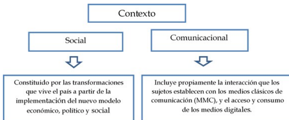
Figura 1: elementos propios del modelo educomunicativo propuesto.

Donde el componente social estaría conformado por los actores sociales, el organizacional por todas las instituciones representadas en la localidad, y el humano por los sujetos y a su vez estos estarían siendo afectados por los componentes normativos (regulaciones que definen los objetivos, funciones de los JCCE, la estrategia de acción del municipio, documentos y regulaciones que norman su funcionamiento y la propia estrategia de implementación del modelo) y los comunicativos, dados por las relaciones comunicativas que se establecen entre los diferentes actores del modelo, al interior del Palacio y de este con el resto de los actores locales. Incluye las acciones comunicativas que se realizan en función de lograr los niveles deseados de participación ciudadana.